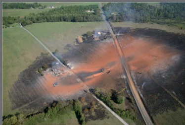
Conséquences d'une fuite sur une canalisation de transport, Appomatox (USA), 14 septembre 2008.