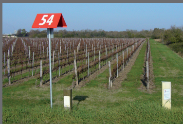
Différents types de bornes repérant les canalisations de transport