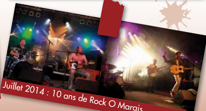
Juillet 2014 : 10 ans de Rock O Marais