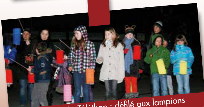
Décembre 2014 : Téléthon : défilé aux lampions