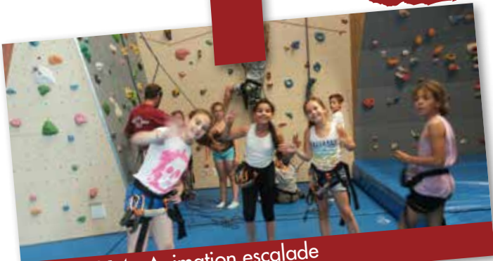
Juillet 2014 : Animation escalade