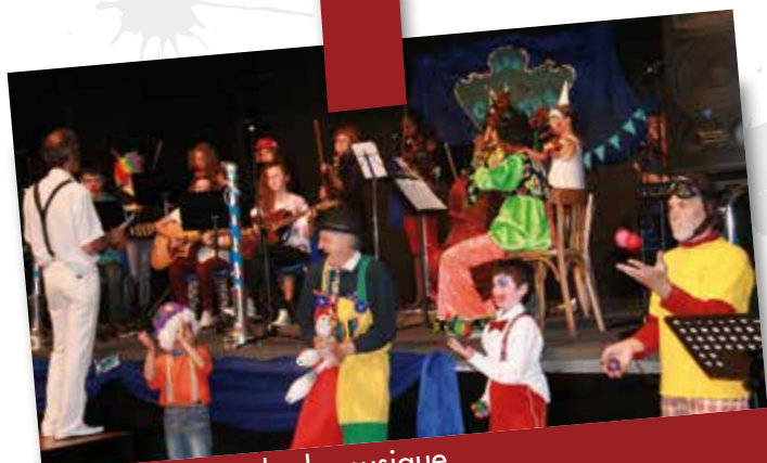
Juin 2014 : Ecole de musique