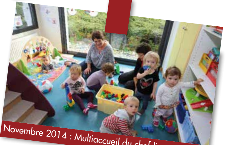
Novembre 2014 : Multiaccueil du chef-lieu