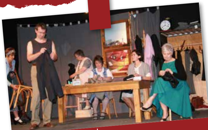
Janvier 2014 : L'Estrade