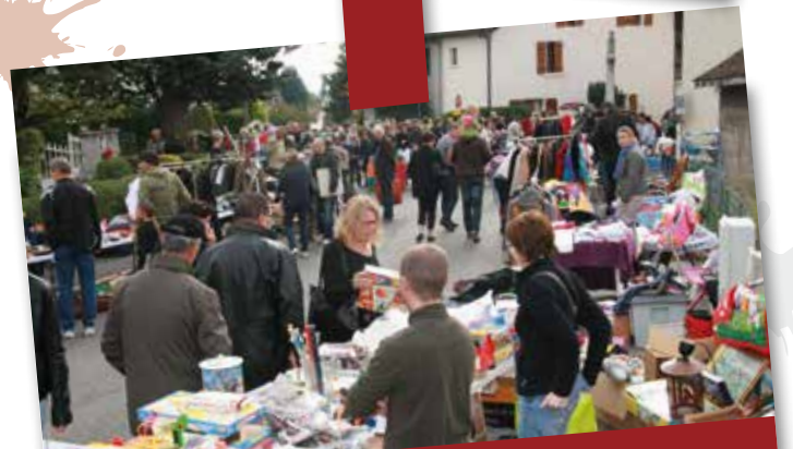
Octobre 2014 : Fête au village