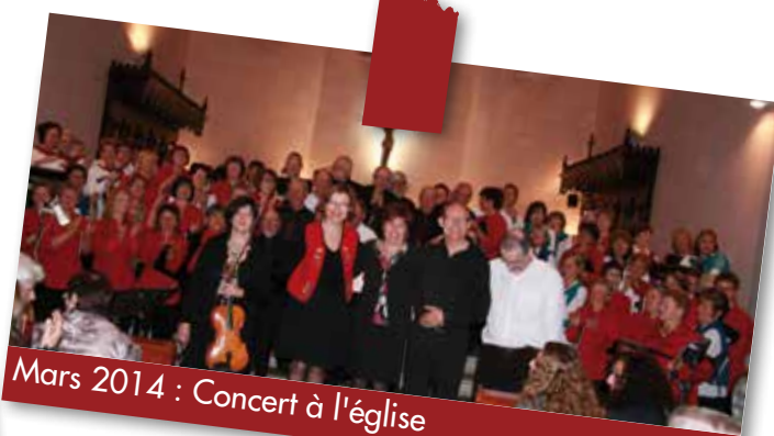
Mars 2014 : Concert à l'église