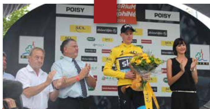
Juin 2014 : Critérium du Dauphiné Libéré