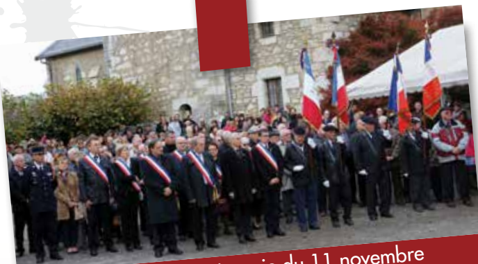
Novembre 2014 : Cérémonie du 11 novembre