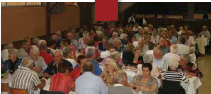
Octobre 2014 : Repas des anciens