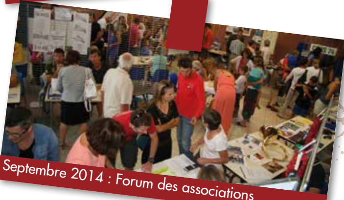
Septembre 2014 : Forum des associations