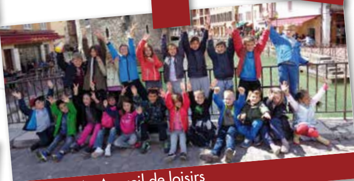
Avril 2014 : Accueil de loisirs