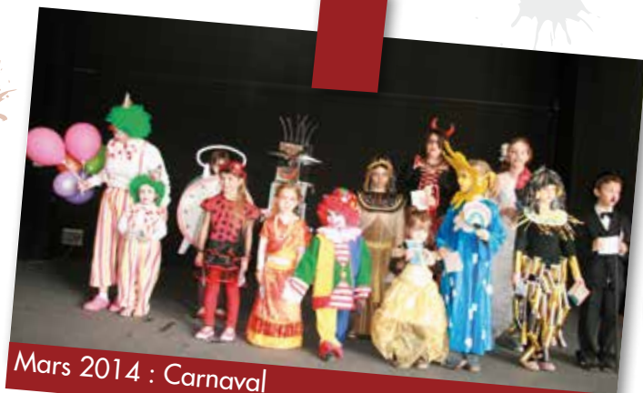
Mars 2014 : Carnaval