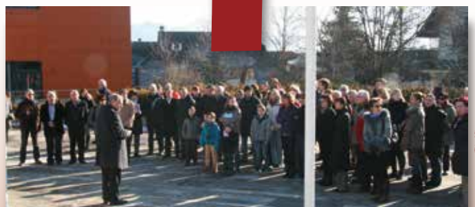
Janvier 2015 : Minute de silence et d'émotion en mémoire des victimes des attentats de Paris