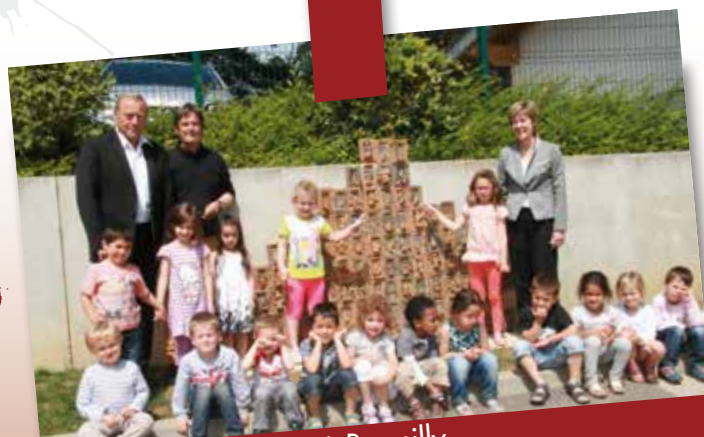
Juin 2014 : Sculpture à Brassilly