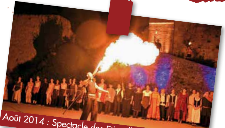
Août 2014 : Spectacle des Etincelles