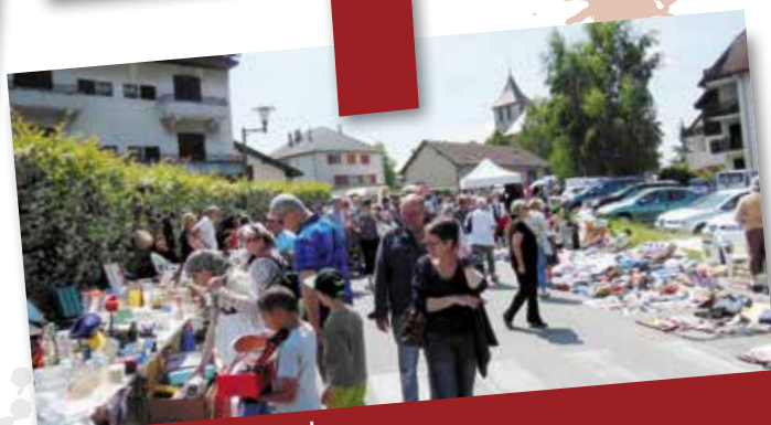
Juin 2014 : Brocante